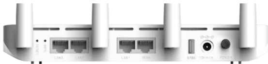
Rys. 2 Panel tylny