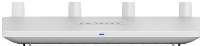
Rys. 1 Panel przedni