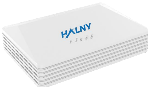
Rys. 1 Panel przedni