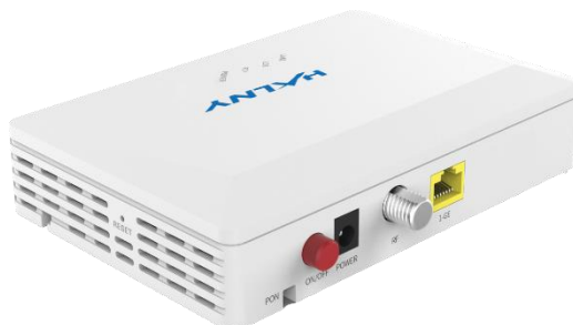
Rys. 2 Panel tylny