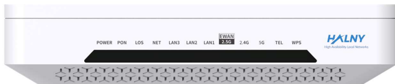
Rys. 1 Panel przedni