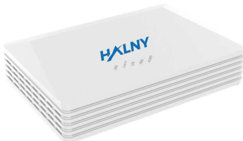
Rys. 1 Panel przedni