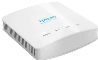
Rys. 1 Panel przedni