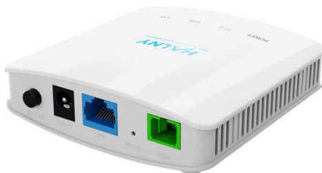
Rys. 2 Panel tylny